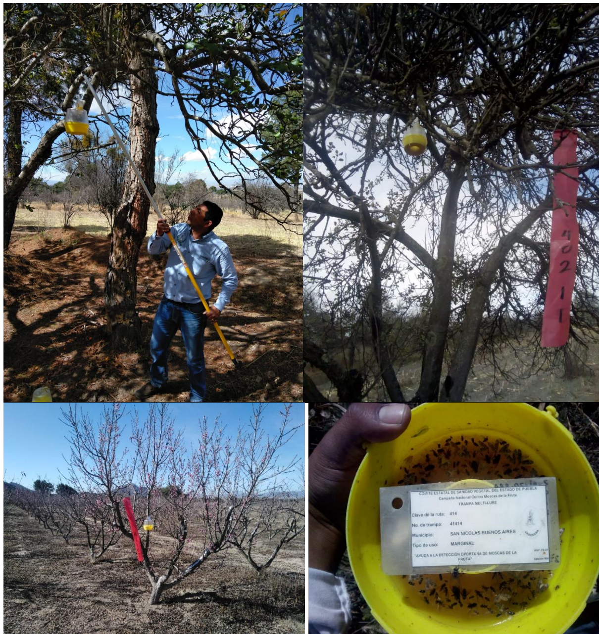
Trampeo en las rutas de la región Valle de Serdán.

Evidencia fotográfica de las acciones realizadas del manejo integrado de moscas de fruta, durante el mes de enero de 2020.